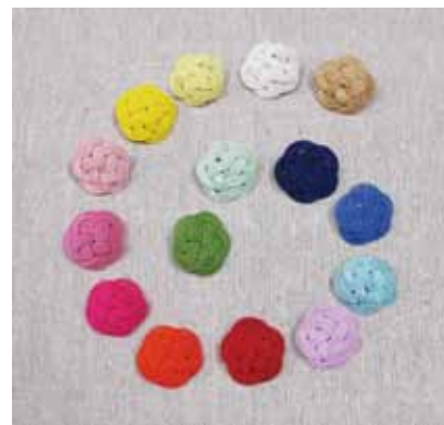
水引ブローチ平梅大