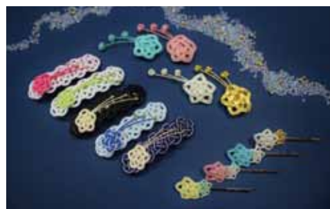
水引流れ星 バレッタ/ブローチ/ヘアピン