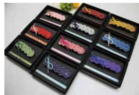
水引バレッタリボン