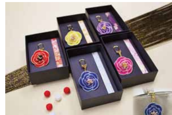
水引バックチャーム