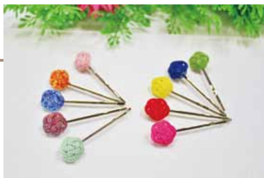
水引ヘアピン平梅