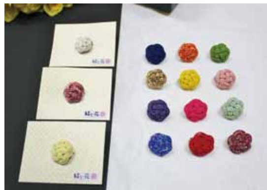
水引ブローチ平梅小

飛鳥時代に小野妹子が遣隋使として帰朝のおり天皇への献上品に紅白で染めた麻紐を結んであったのが水引の始まりです。