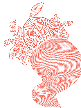
神宮館の暦の表紙に使われている神亀

「神亀」のデザインにもこだわり、神宮館監修の正月飾りに取り入れ、強い縁起物となるようお願いを込めています。