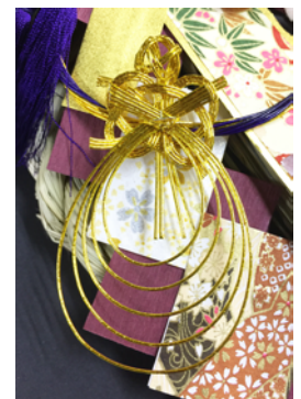
神宮館監修の正月飾りに付いている神亀の水引