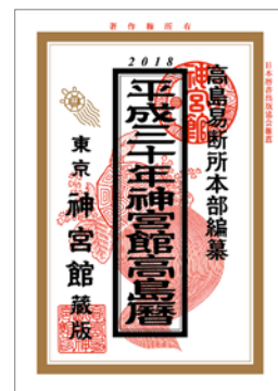
平成30年神宮館高島暦

「正月飾り」とは、古い年の不浄を祓い、清めるために飾るものです。神道では、その年の新しい神様（年神様）が家々を訪れ、一年の幸いを授けてくれると考えられており、正月飾りは新たな年神様を迎える準備が整ったことも表します。